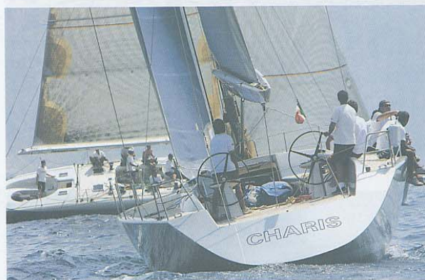
Dall'alto: Damiani Ourdream in azione a Capri; Charis , uno dei maxi in regata alla Tre Golfi. A sinistra: My Song di Loro Piana sfila lungo le scogliere di Capri