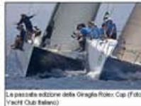
La passata edizione della Giraglia Rolex Cup

Il programma della regata prevede tre giorni di prove costiere a St Tropez da domenica 8 a martedì 10 giugno. Mercoledì 11 inizia la prova d'altura: dallo storico porto di Saint Tropez in Francia, la flotta prosegue verso le Iles de Hyères e attraversa il mare per circumnavigare Giraglia, un'isola rocciosa che si trova a nord della Corsica, prima di terminare a Genova, il 14 di giugno, coprendo una distanza totale di 243 miglia.